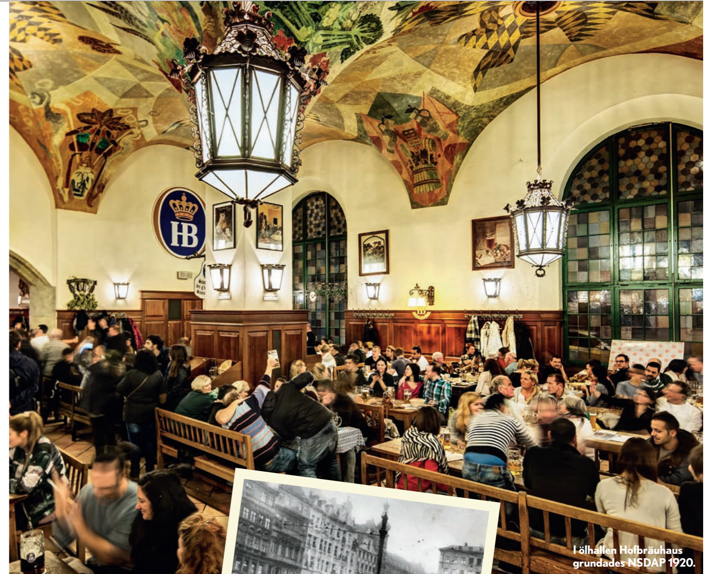
I ölhallen Hofbräuhaus grundades NSDAP 1920.