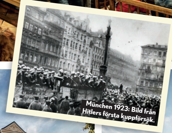
München 1923: Bild från Hitlers första kuppförsök.