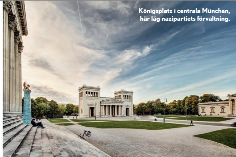
Königsplatz i centrala München, här låg nazipartiets förvaltning.

Kring museerna som stod där utökade nazisterna platsen med "Äretempel" för stupade kämpar och representationsbyggnaden "Führerbau", som står kvar än i dag.