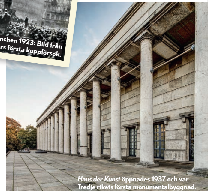
Haus der Kunst öppnades 1937 och var Tredje rikets första monumentalbyggnad.