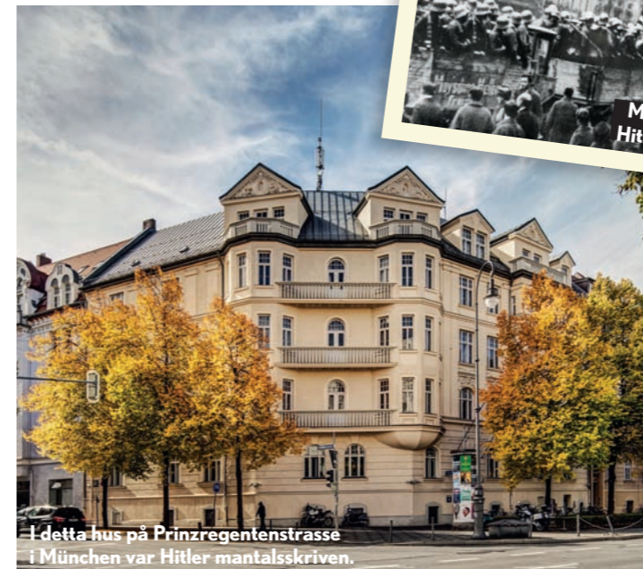
I detta hus på Prinzregentenstrasse i München var Hitler mantalsskriven.